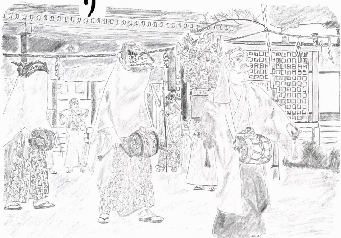
諏訪神社の獅子舞 (お座敷ざさら)